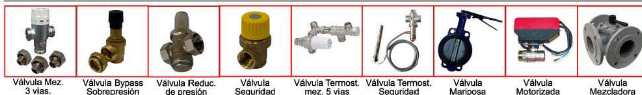
Válvula Mez. 3 vías.